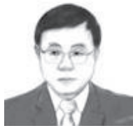
廖建宇 辽宁省委常委、省纪委书记、省监委主任

成员分管派驻机构工作规则，强化国企、高校纪检监察机构派驻功能，开展垂直管理单位和以上级管理为主单位的纪检监察体制改革试点。