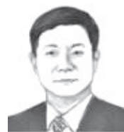
王拥军 山西省委常委、省纪委书记、省监委主任

势。在去年全省立案首次突破 2000 件、44 个县市区首次实现立案全覆盖、365 个乡镇中有 60% 突破零立案的基础上，坚持执纪执法同向发力，坚决查处不收敛、不收手，群众反映强烈的突出问题，持续强化“不敢腐”的震慑。二是下大气力扎牢“不能腐”的制度笼子。对审查调查和省委巡视发现的重点问题推进整改，用好纪检监察建议书，完善“一案一总结、一案一建议、一案两整改”机制，继续推进县市区重点经济职能部门一把手易地交流制度等，着力解决体制机制存在的突出问题。三是分层分类拓展案件警示教育。利用典型案例分领域、分对象加强针对性教育，在党政机关领导干部、脱贫攻坚领域、生态环保领域、省属国有企业、乡镇基层干部中广泛开展用身边事教育身边人活动，筑牢“不想腐”的思想防线。