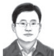
蓝佛安 海南省委常委、省纪委书记、省监委主任

做好监督执纪“后半篇文章”。三是推动四个监督协同化。制定巡视机构与纪委监委协作配合的意见，建立纪检监察室与派驻机构信息共享、共同研判驻在部门政治生态、办案协作等机制；统筹推进巡视和整改落实“回头看”两个全覆盖，开展对市委巡察指导督导试点和县（市、区）巡察工作专项检查。