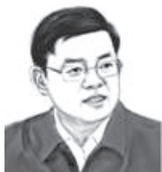
张忠 吉林省委常委、省纪委书记、省监委主任

下一步,海南省纪检监察机关将持续深化纪检监察体制改革,着重在整合规范监督执纪执法工作流程及推进执纪执法贯通、有效衔接司法等方面下功夫,推动形成与审判机关、检察机关、执法部门互相配合、互相制约的工作机制。紧紧围绕运用监察法规定的谈话、讯问、询问等调查措施完善制度机制,严格依法行使监察权,依照法定权限、规则、程序做好每一项工作、办好每一起案件,确保纪检监察工作始终在规范化法治化轨道上运行。