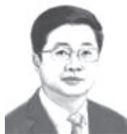
滕佳材 青海省委常委、省纪委书记、省监委主任

考，必须以改革为动力推进国家治理体系和治理能力现代化。参加十三届全国人大三次会议的省市区纪委书记、监委主任表示，纪检监察机关将坚决落实中央纪委四次全会精神，持续深化“三项改革”，推动健全党和国家监督体系，不断将制度优势转化为治理效能。